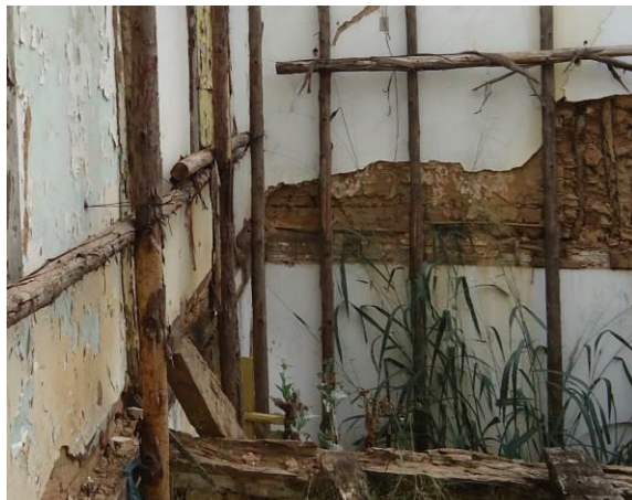
Foto 05 – Alvenaria Interna (lado esquerdo e fundos para porção posterior da edificação)