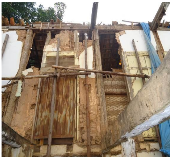
Foto 07 – Alvenaria Interna (fundos para porção posterior da edificação)