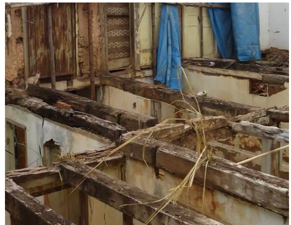
Foto 06 – Alvenaria Interna (fundos para porção posterior da edificação)